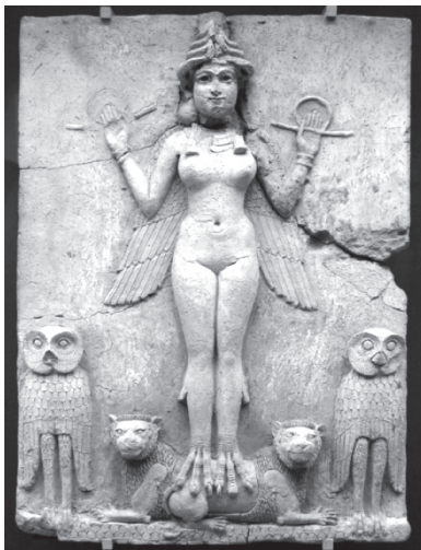
Istar istennő egy közel négyezer éves babiloni domborművön (British Museum)